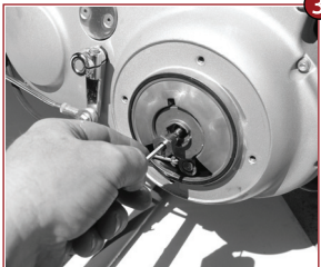
Kupplungsmutter entfernen Remove clutch locknut